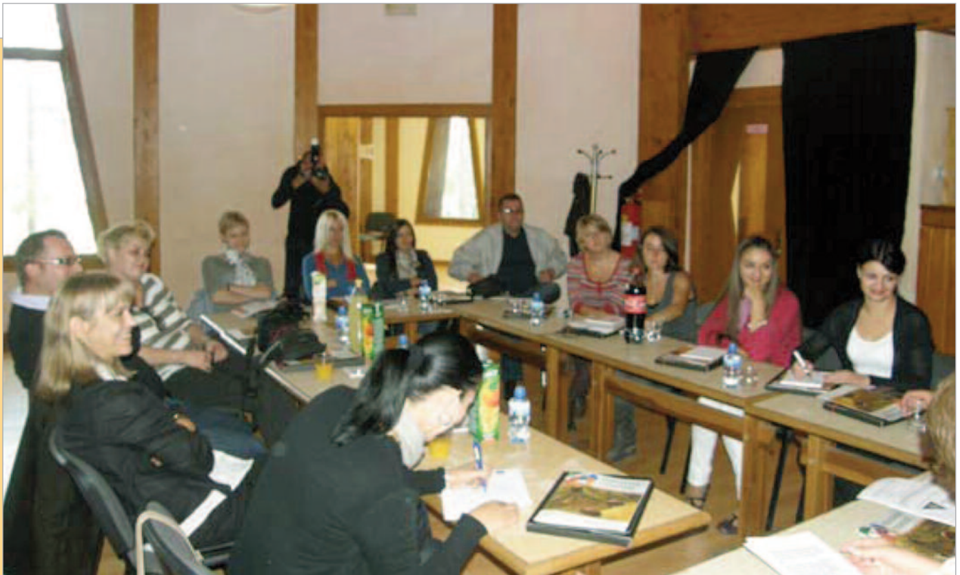
"Doručak sa novinarima" u Tuzli, 29. septembar 2012.

U toku ove godine, napravljena je Metodologija za monitoring medija , raspisan je novi Konkurs za novinarsku nagradu Srđan Aleksić i Poziv za dostavljanje fotografija na temu marginalizovanih grupa i obilježen je Dan ljudskih prava .